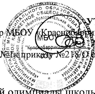
График проведения муниципального этапа всероссийской олимпиады школьников в 2021-2022 учебном году